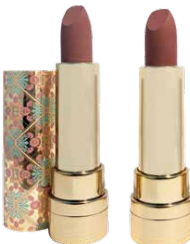
Barra de labios n° 01 latte The Mosaic.