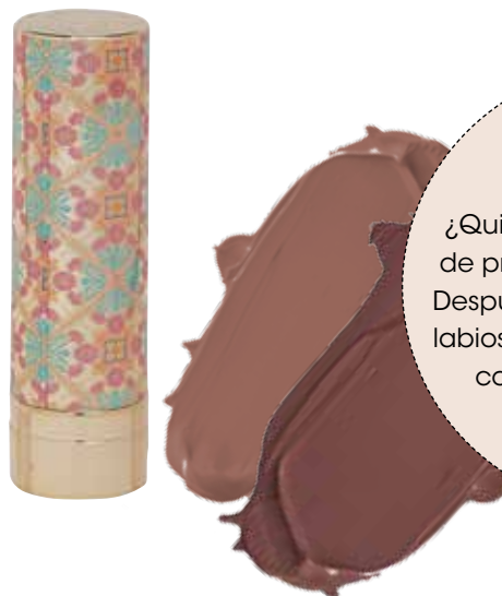
Barra de labios n° 02 mocha The Mosaic.