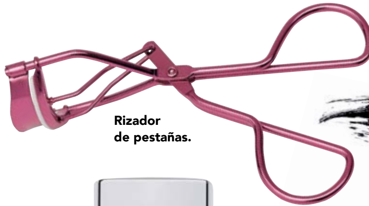
Rizador de pestañas.