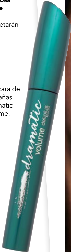
Máscara de pestañas Dramatic Volume.