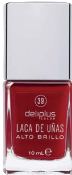
Esmalte de uñas n°39.