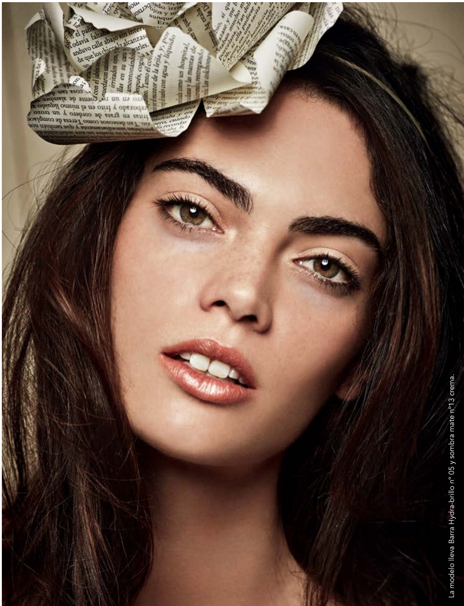
La modelo lleva Barra Hydra-brillo n° 05 y sombra mate n° 13 crema.