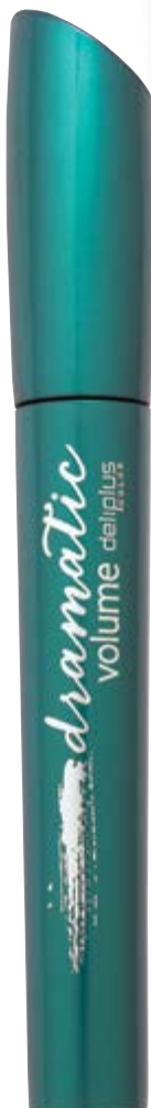
Máscara de pestañas Dramatic Volume.