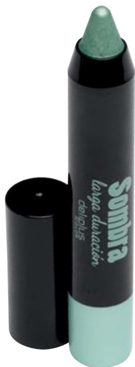
Sombra larga duración n°03 verde.