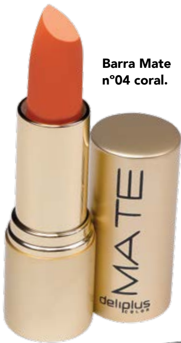
Barra Mate n°04 coral.