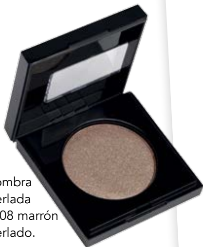
Sombra perlada n°08 marrón perlado.

Reinventa el efecto ahumado en maquillaje de ojos dándole un giro con nueva textura y colorido. Miradas mágicas para esta primavera.