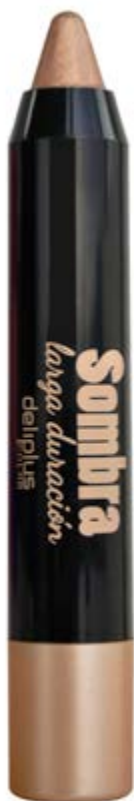
Sombra larga duración n°06 oro antiguo.