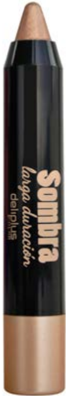
Sombra Larga Duración n°06 oro antiguo.