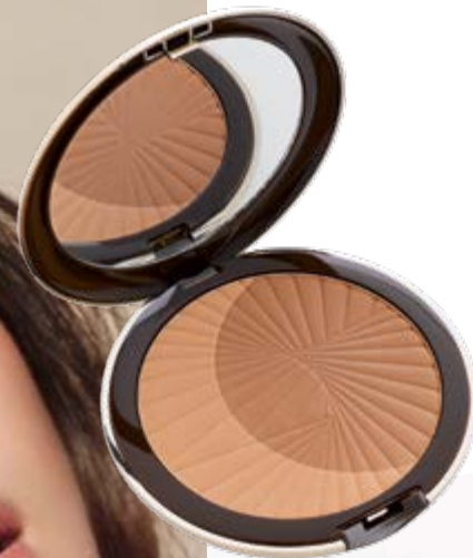
Polvos de Sol.