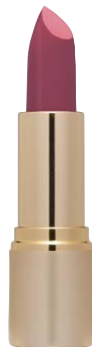
Barra Mate n°09 violeta.

Obtén este look con la Sombra larga duración n°06 oro antiguo, la Sombra mate n°02 negro, el Intense eyeliner, la Máscara de pestañas Volumen 4Dimensiones, el Colorete n°03 dorado. Para finalizar aplica primero la Barra Mate n°09 violeta y después una generosa capa de Brillo de labios n°11 transparente .