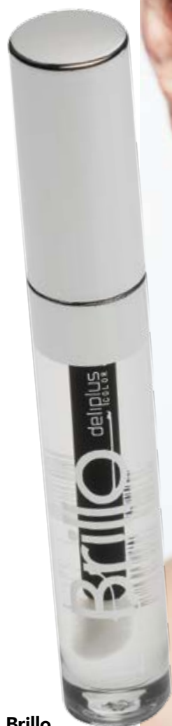
Brillo labios n°11 transparente.