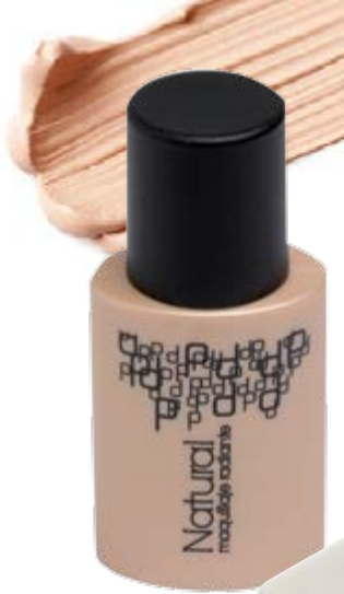
Maquillaje Natural n°01 y Esponja maquillaje triángulo (disponible en varios colores).