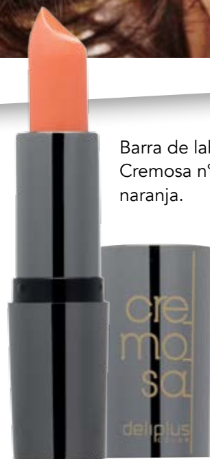
Barra de labios Cremosa n°10 naranja.