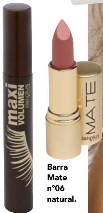
Barra Mate n°06 natural.