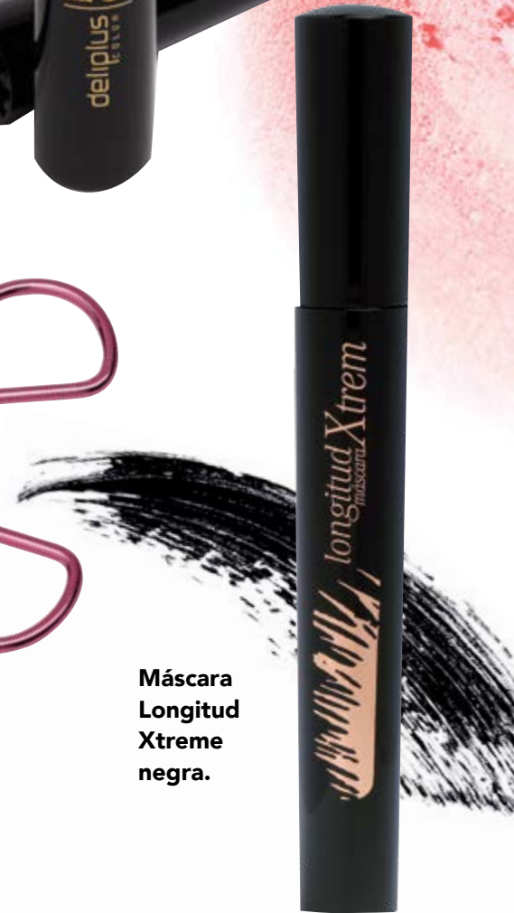
Máscara Longitud Xtreme negra.