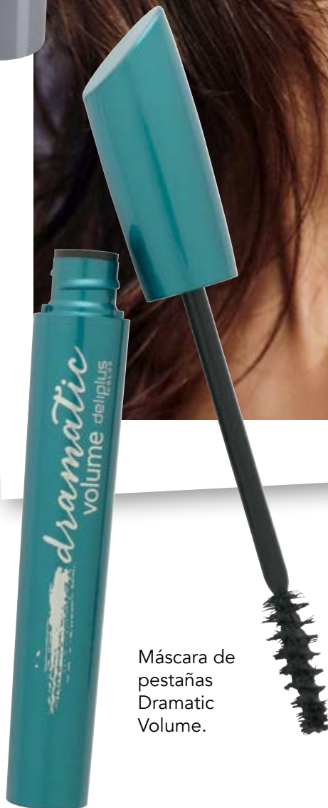
Máscara de pestañas Dramatic Volume.