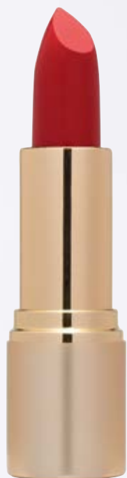
Barra Mate n°11 rojo.

Consigue este maquillaje con la Sombra larga duración n°06 oro antiguo, el Intense eyeliner, la Máscara de pestañas Volumen 4Dimensiones, el Colorete n°03 dorado. Para finalizar aplica primero la Barra Mate n°11 rojo y después una generosa capa de brillo de labios n°11 transparente .