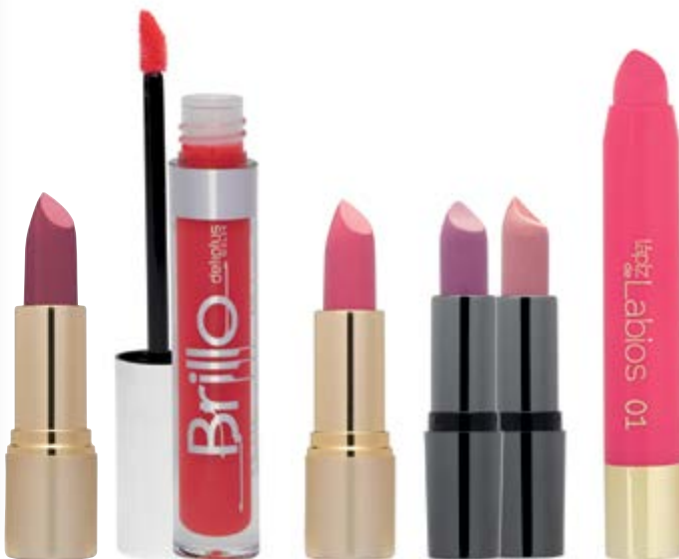
Barra de labios Cremosa nº10 naranja.