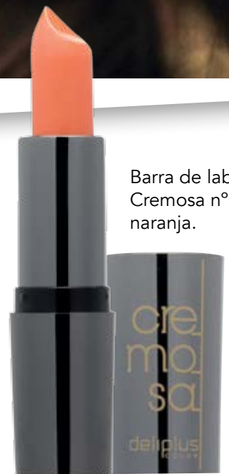
Barra de labios Cremosa n°10 naranja.