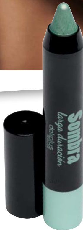
Sombra Larga Duración n°03 verde.