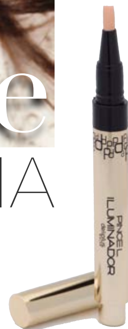
Pincel Iluminador n°01 rosado.