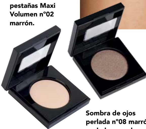
Sombra de ojos perlada n°08 marrón perlado y sombra mate n°13 crema.