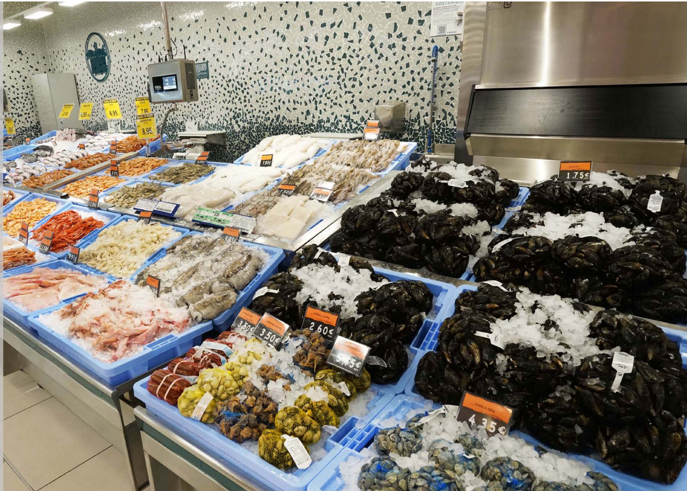
Supermercat de Periodista Azzati al Port de Sagunt, València.

Els murals de trencadís, elaborats per més de 200 persones amb discapacitat intel·lectual, adapten el seu estil al Nou Model de Botiga. Els murals presenten un nou disseny més ampli, i en sintonia amb la nova imatge de la companyia, per a ambientar les seccions de carn, xarcuteria i peix.