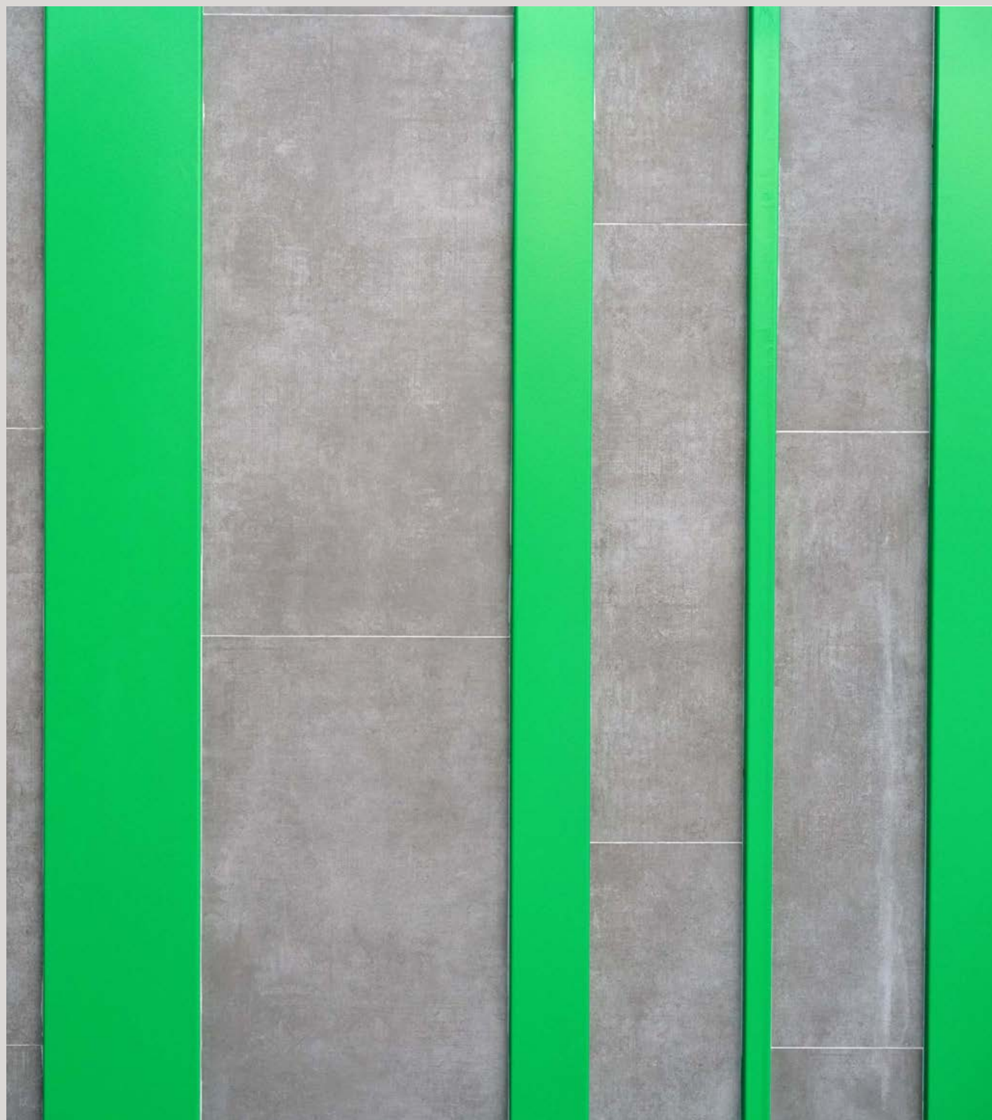
Detall de la façana que representa el codi de barres.