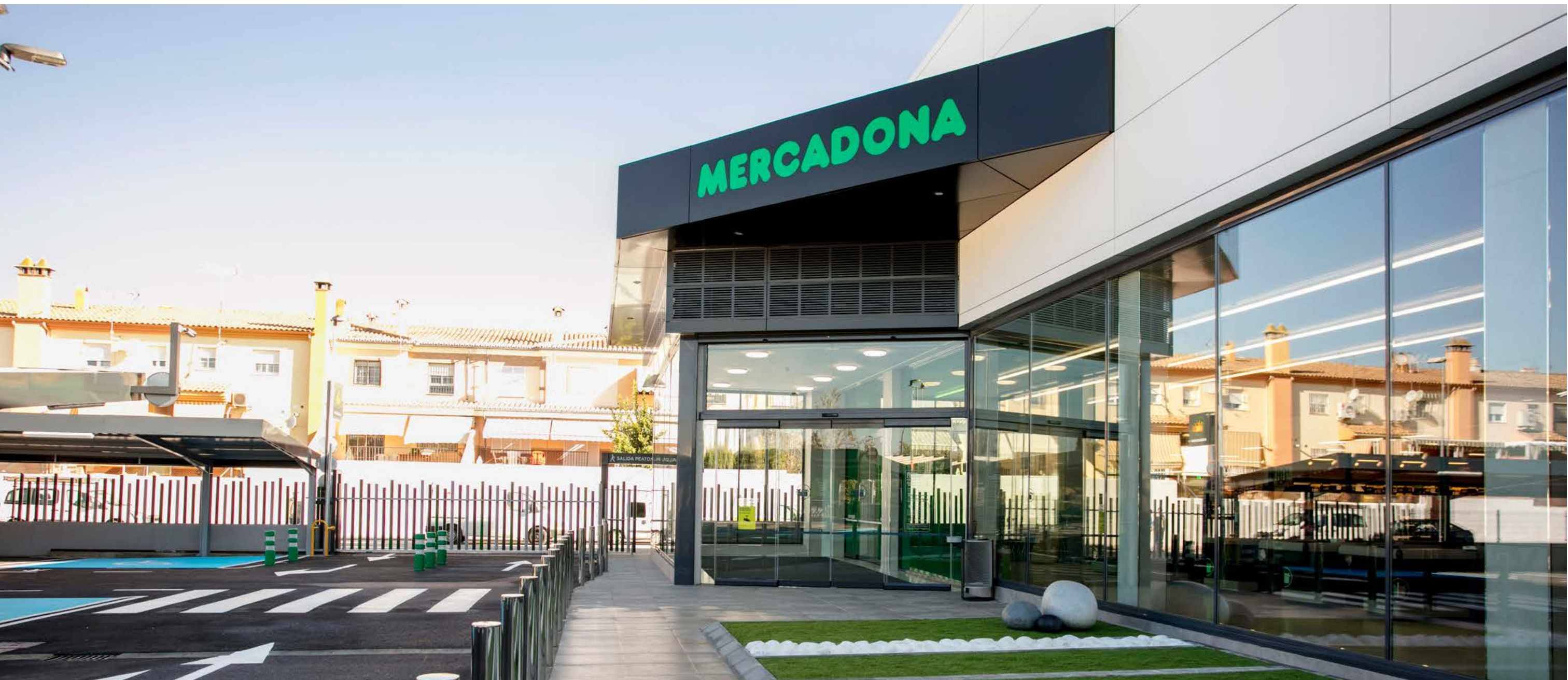
Façana del supermercat de Peligros, Granada.