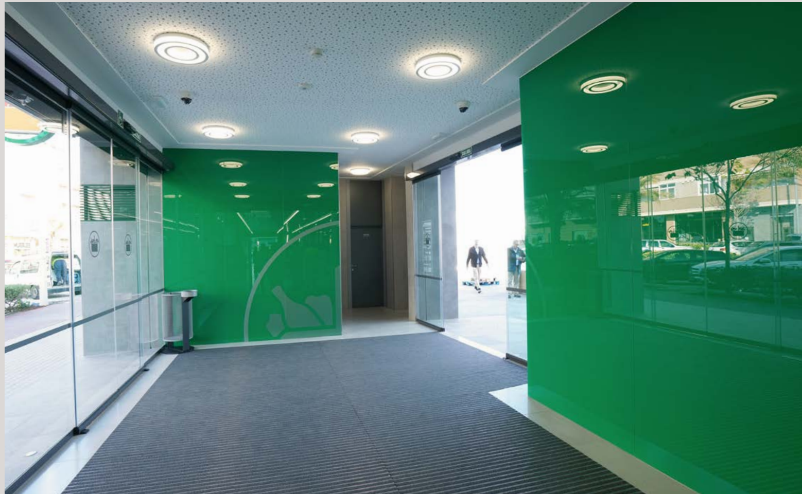
Accés a la botiga del supermercat Periodista Azzati al Port de Sagunt, València, caracteritzat per la seua amplitud i lluminositat.

El sostre s'ha elaborat amb plaques viníliques més lleugeres, que milloren la calidesa de l'ambient, i el material principal utilitzat, tant en caixes com en algunes seccions, és el termoplàstic, per la seua resistència als cops i als canvis de temperatura.