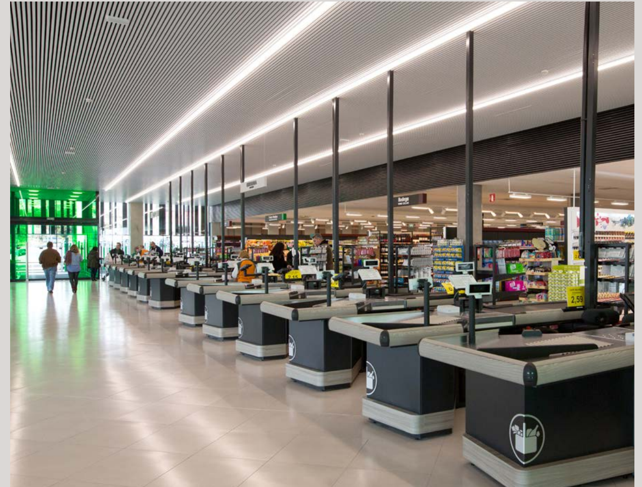
Línia del nou moble de caixes del supermercat de Finestrat La Marina, Alacant.