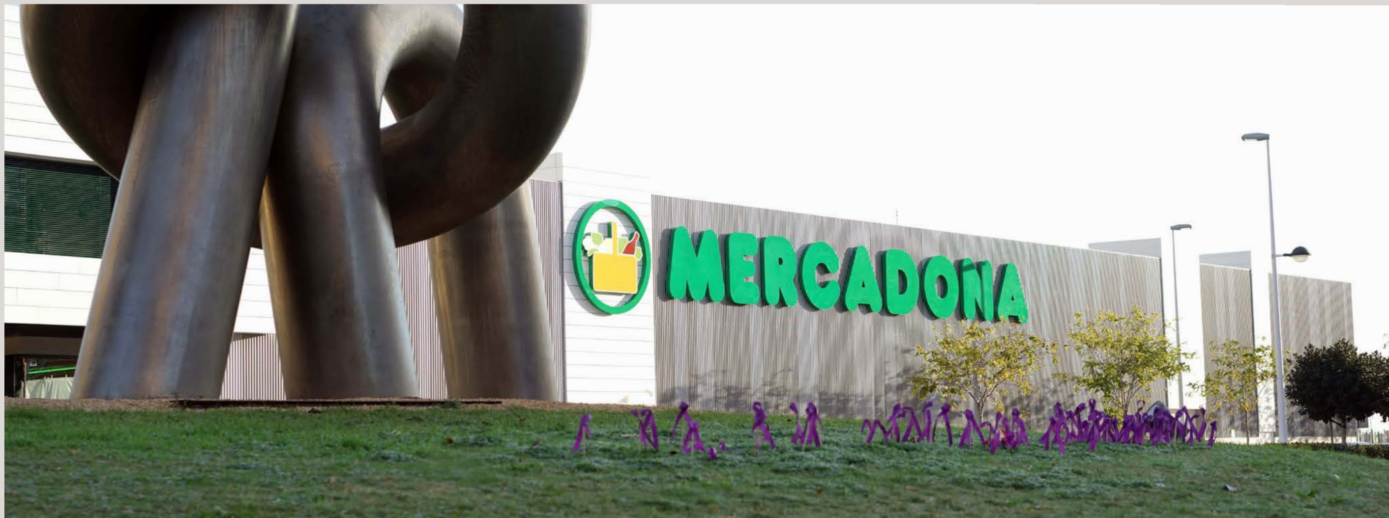
Fachada do supermercado de Periodista Azatti en Puerto Sagunto, Valencia.

O supermercado de Puerto Sagunto (Valencia) e o de Peligros (Granada), son as dúas primeiras tendas en implantar o Novo Modelo de Tenda Eficiente