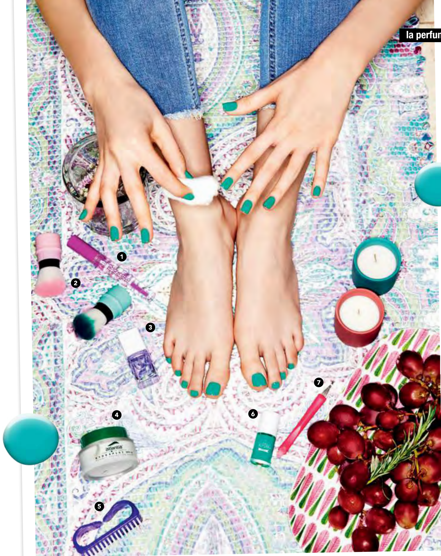
Eskuetan eta oinetan, New California azazkal-esmalte 757 zk. berdea . (1) Betile-maskara gardena / (2) Hautsetarako brotxa bilkorra , arrosa eta berdea / (3) Gogortzailea / (4) Hydraplus FPS15 Atlantia aurpegi-krema / (5) Azazkal-eskuila / (6) New California azazkal-esmalte 757 zk. berdea / (7) Kutikula-kentzekoa .