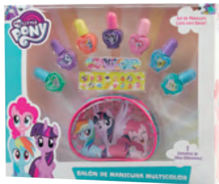
My Little Pony Manikura-seta.