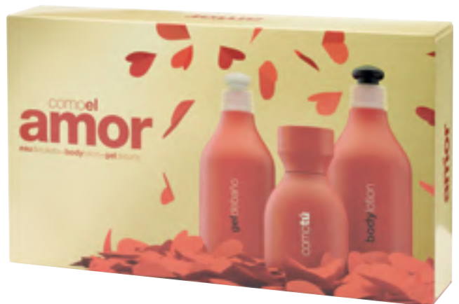
Comotú amor. Eau de toilette, bainurako gela eta gorputzeko lozioa.