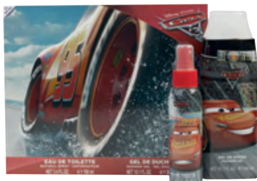
Cars Eau de toilette eta dutxarako gela.