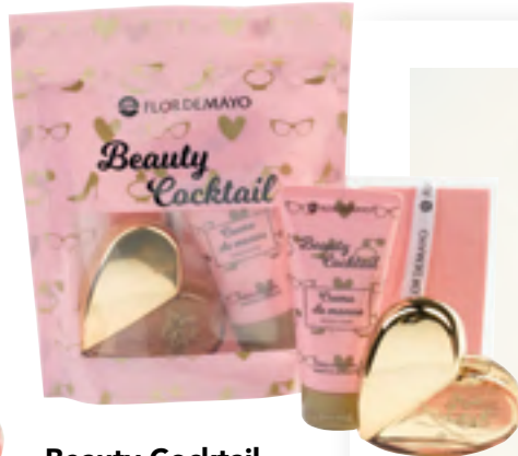
Beauty Cocktail Flor de Mayo Esku-krema, Big Gold Love lurrina eta osagarri bat.