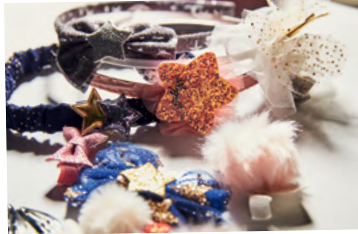
Ilerako haurrentzako osagarriak Matxardak, urkilak, turbantea eta diademak.