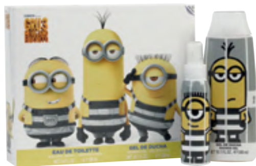
GRU3. Mi Villano Favorito Eau de toilette eta dutxarako gela.