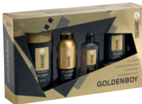
Goldenboy 4Square Gel-xanpua, body spray, desodorantea, eau de toilette eta after shave baltsamoa.