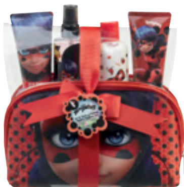
Prodigiosa Bainuko seta eta lurrina.