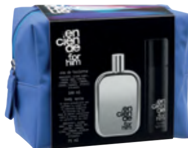
Enciende for him Eau de toilette, body spraya eta nezeserra.