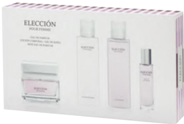
Elección. Eau de parfuma, gorputzeko lozioa, bainurako gela eta minieau de parfuma.