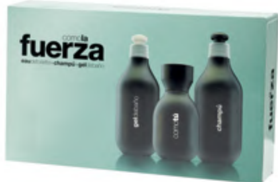
Comotú Fuerza Eau de toilette, bainurako gela eta xanpua.