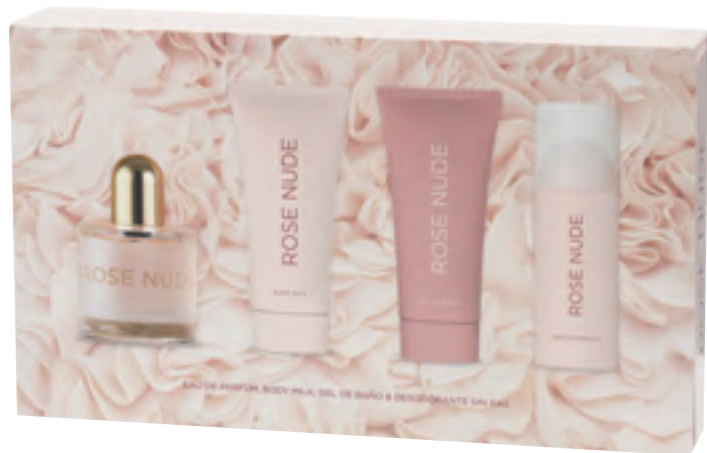
Rose Nude. Eau de parfuma, body milka, bainurako gela eta desodorantea (espraian, gasik gabea).