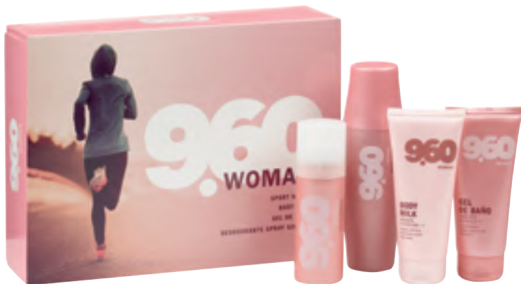
9.60 WOMAN. Eau de toilette, desodorantea (espraian, gasik gabea), body milka eta bainurako gela.