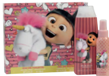
Agnes. Mi Villano Favorito Eau de toilette eta dutxarako gela.