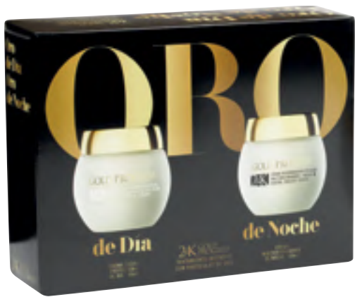
24K Gold Progress Oro eguneko krema 50 ml eta Oro gaueko krema (orain, 50 ml- koa ere bai).

Nezeserrak, zenbait modelo eta tamaina aukeran.