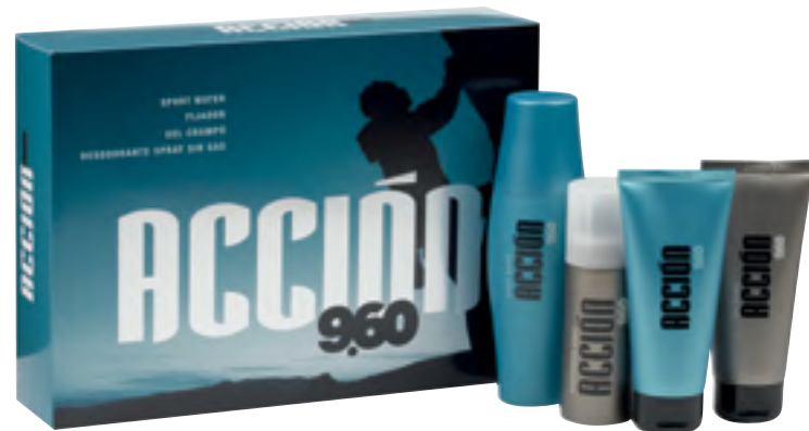
Acción 9.60. Sport watera, finkatzailea, gel-xanpua eta desodorantea (espraiari, gasik gabea).