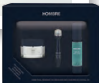
Vído Hombre. 24 orduko aurpegi-krema hidratatzailea, adinaren aurkako seruma eta begi-ingururako roll-ona.