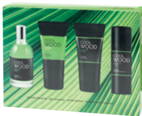
Cool Wood Esencia Vital Eau de toilette, bainurako gela, after shavea eta desodorantea (espraiari, gasik gabea).