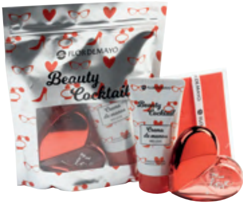
Beauty Cocktail Flor de Mayo Esku-krema, Big Red Love lurrina eta osagarri bat.