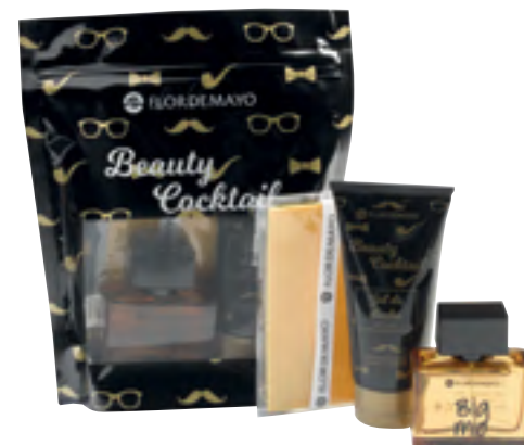
Beauty Cocktail Flor de Mayo. Dutarako gela, Big mio lurrina eta osagarri bat.