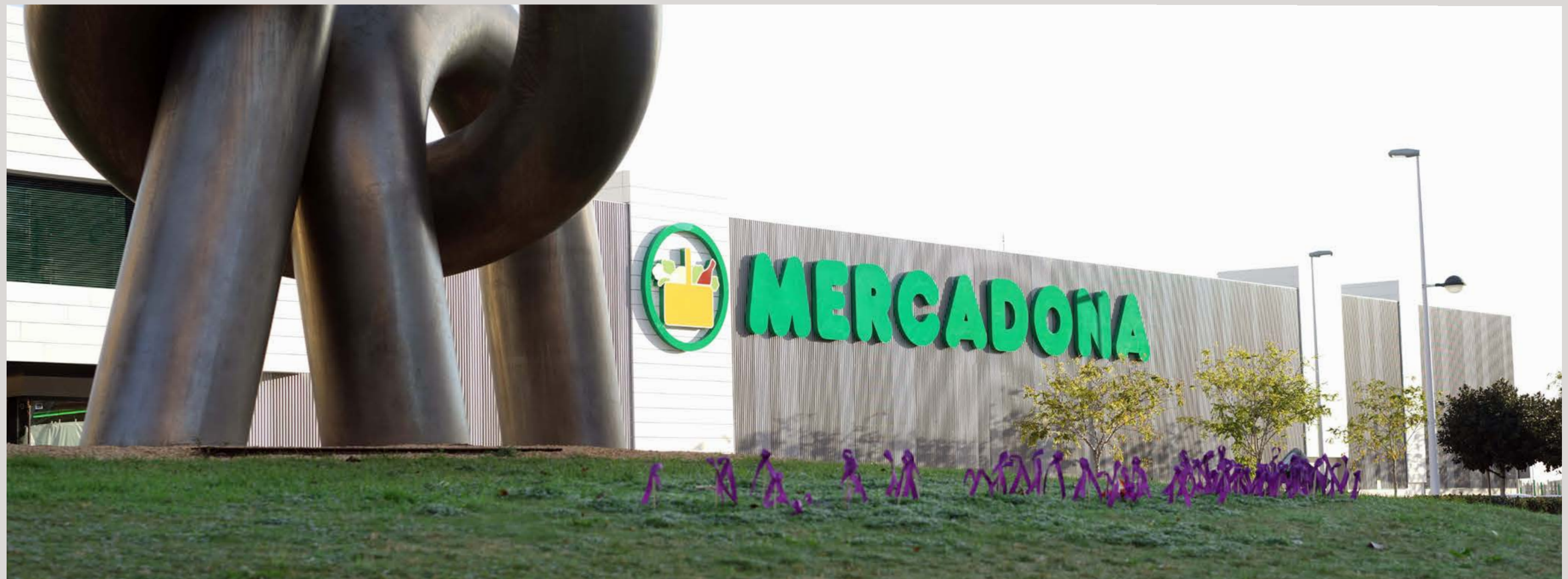
Façana del supermercat de Periodista Azzati a Port de Sagunt, València

El supermercat de Port de Sagunt (València) i el de Peligros (Granada) són les dues primeres botigues que han implantat el Nou Model de Botiga Eficient