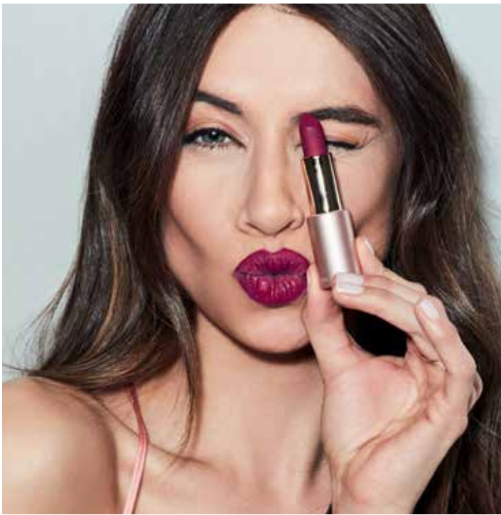
La modelo lleva: Mate n° 109.