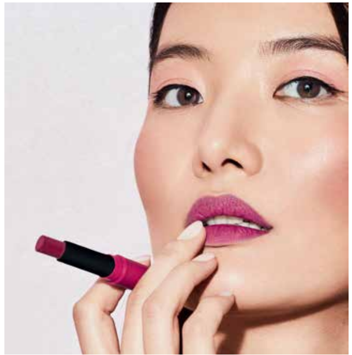
Hau darama modeloak: 04 zk.-ko Color Fix

105 ZK.-KO FUKSIA BIZIA ETA 109 ZK.-KO MUGURDI-KOLOREA