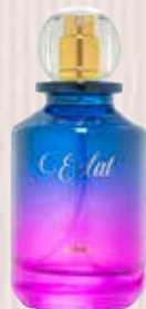
4 Éclat Shine Ekialdeko usain-ukitua, mugurdia, fruitu gorriak Eau de Parfuma