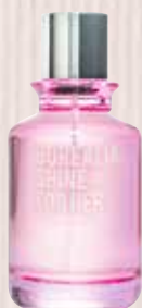
7 Borealia Shine For Her Fruita-usainaren ukitua Eau de Parfuma