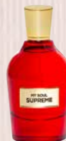
9 My Soul Supreme Ekialdeko lore-usainaren ukitua Eau de Parfuma