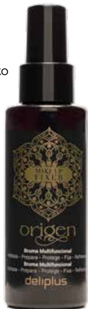
Aurpegirako Ihintza Origen

Aplikatu ihintza eguneroko zure skincare -errutina baino lehen, azala prestatzeko, edo makillajearen ondoren, haren iraupena luzatzeko.