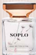
11 Soplo Lore-usainaren ukitua Eau de Toilettea