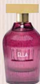
6 Ella Ekialdeko lore-usainaren ukitua Eau de Parfuma